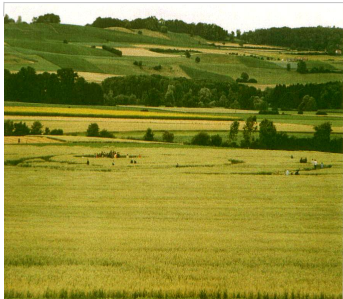
Bild 2 Eine Übersicht zu den Ausmaßen des Kornkreises