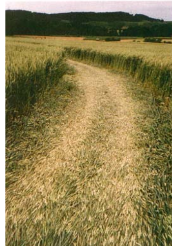
Bild 3 Ein Kreisring in Nah-Aufnahme

Zuhause ergaben die drei Ähren vom Kreisring immer noch - 200 V/m (Typ 475 B), die anderen sechs weiterhin 0 V/m.